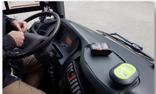
Un véhicule de la CAPCA équipé de la solution Ubitransport

Dès Septembre 2018, la CAPCA, Communauté d'Agglomération de Privas Centre Ardèche, proposera un service complet de vente de billets en ligne et en agence. Expérimenté dans un premier temps sur le secteur de Saint Sauveur de Montagut, la solution Ubitransport, 2Place, sera progressivement déployée auprès des 2200 élèves et de tous les usagers du futur réseau urbain, T'Cap, de Privas et des lignes régulières de la Communauté d'Agglomération.