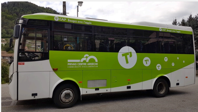
Un véhicule de la CAPCA aux nouvelles couleurs du réseau

Depuis le 3 Mai 2018, 18 véhicules de la Communauté d'Agglomération de Privas Centre Ardèche sont équipés de la Billettique/SAE numérique d'Ubitransport. Une expérimentation pour caler au mieux l'organisation du nouveau réseau en constitution qui atteindra 55 véhicules à la rentrée prochaine.